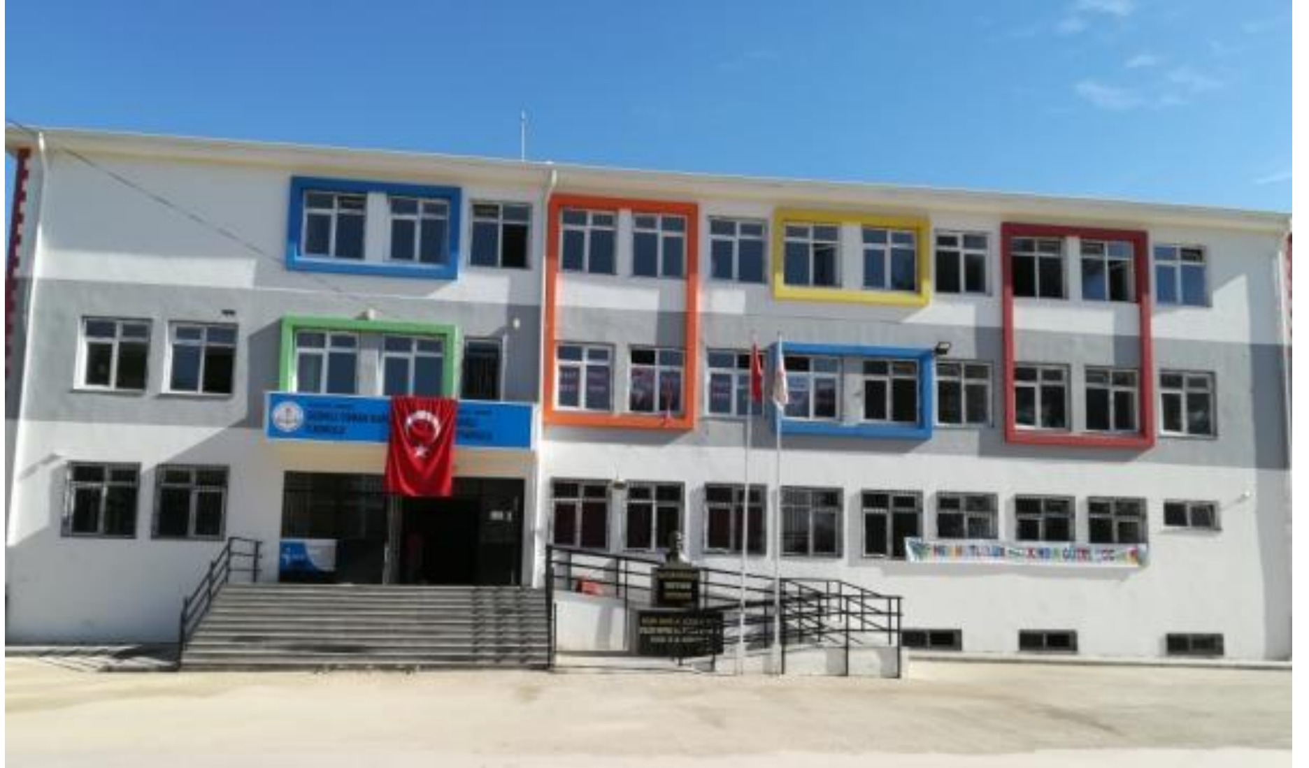
GEDİKLİ OSMAN KAPLAN İLKOKULU/ GEDİKLİ ORTAOKULU